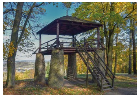
Platforma widokowa Bezručův – Hradec nad Moravicí / Bezručůva vyhlídka – Hradec nad Moravicí

Po noclegu w Opawie lub okolicach kontynuujemy naszą samochodową wycieczkę w Czechach, by pod koniec dnia wrócić do Polski.