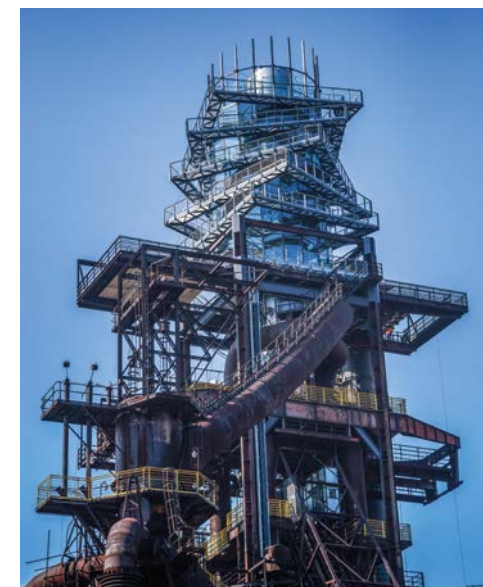
Wielki Piec nr 1 z nadbudową Bolt Tower – Ostrava / Vysoká pec č. 1 s nástavbou Bolt Tower – Ostrava

Po noci strávené v Opavě nebo okolí pokračujte v našem automobilovém výletu v České republice a ke konci dne se vrátíte do Polska.