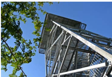
Wieża widokowa w Pietrowicach Wielkich / Rozhledna v Pietrowicach Wielkich