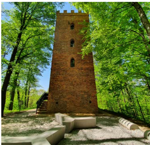
Baszta Rycerska w Wodzisławiu Śląskim / Rytierska bašta ve Wodzisławiu Śląskim

Samochodowa, dwudniowa wycieczka szlakiem „Silesianka” wiodzie śladem najciekawszych wież widokowych polsko-czeskiego pogranicza. Rozpoczyna się przy Baszcie Rycerskiej w Wodzisławiu Śląskim , w której można się zaopatrzyć w materiały o całym szlaku.