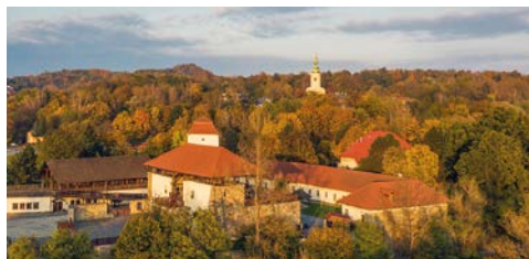
Zamek Śląskoostrawski / Slezskoostravský hrad