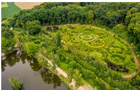
„Zaczarowany Ogród” w Arboretum Bramy Morawskiej w Raciborzu / „Začarovaná zahrada” v Arboretu Moravské brány v Raciborzu