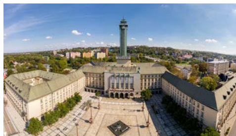
Wieża widokowa Nowego Ratusza – Ostrava / Vyhlídková věž Nové radnice – Ostrava

Na trasie wyletu se nachází následující rozhledny stezky „Silesianka”: